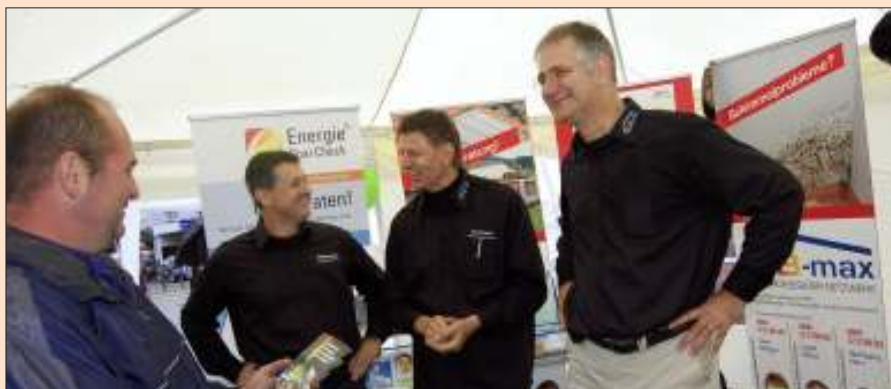
Kompetente Ansprechpartner: Auch zahlreiche Energieberater stehen den interessierten Besuchern beim Aktionstag mit Rat und Tat zur Seite.

sches Bewohnen fast nicht möglich ist. Wird das Konzept vernachlässigt, kann es unter anderem zu Feuchtigkeits- und Schimmelschäden, erhöhten Schadstoffwerten in der Raumluft aus Teppichböden und Möbeln und einem erhöhten CO 2 -Gehalt in den Räumen mit daraus folgenden Schlaf- und Konzentrationsstörungen sowie Unwohlsein kommen. Informationen zu solchen Lüftungskonzepten gibt es bei den Energietagen.