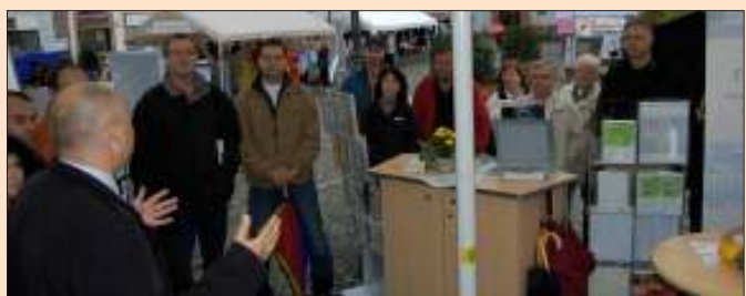
Rückblick: Eröffnung des Energietags 2008 durch Schirmherr OB Schlatterer im Beisein von Ausstellern und Organisatoren.

Emmendingen. 22 Teilnehmer, darunter neben zahlreichen Energieberatern und Energieexperten aus allen Bereichen auch die Stadt, Stadtwerke, Maler- und Lackiererring, Sparkasse und Volksbank präsentieren sich am kommenden Samstag im Rahmen des landesweiten Energietages von 10 bis 16 Uhr auf dem Marktplatz. Interessierte können sich dort unter anderem zu den Themen Energieberatung, Förderprogramme, Heizungstechnik, Lüftungssysteme, Solartechnik, Wärmeschutz oder zu Finanzierungsfragen aktuell, umfassend und kompetent informieren.